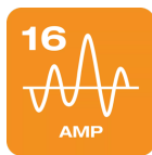
Conecta-se a qualquer unidade ou estação de carregamento de 16 A (trifásica) com uma conexão do tipo 2

Carregue em casa e em trânsito Tipo 2 para Tipo 27 PINOS | TRIFÁSICO